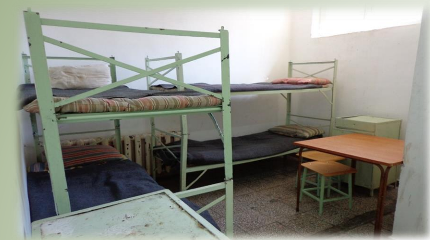
Снимка от затвора в гр. Стара Загора